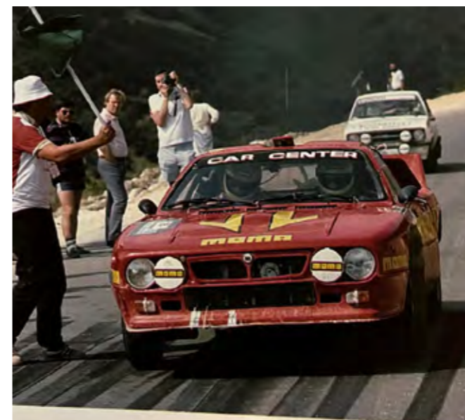
'Melas', the Greek privateer, gets away from a stage start at the wheel of chassis 409, supplied by Corso Marche to Safari specification.